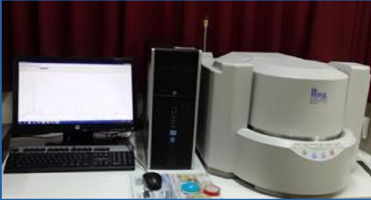
ESPECTRÓMETRO DE FLUORESCENCIA DE RAYOS X SHIMADZU "EDX" 800 HS