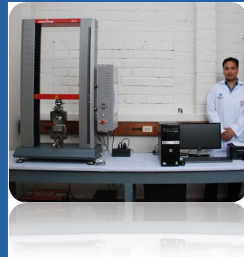
EQUIPO DE TRACCION