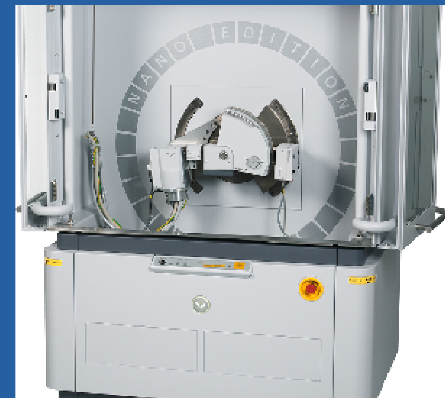
DIFRACTOMETRO DE RAYOS X