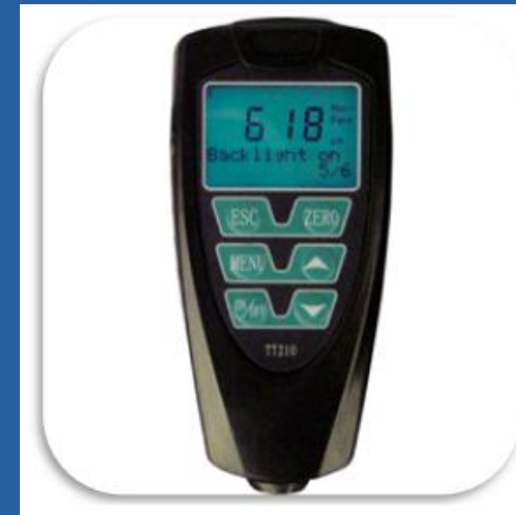
MEDIDOR DE ESPESORES