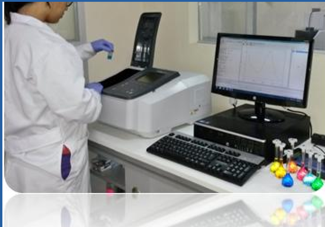
ESPECTROFOTÓMETRO UV-VISIBLE MODELO UV-1800